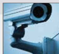
Triple-layered security system