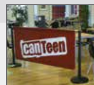
Cafeteria (with delivery service)