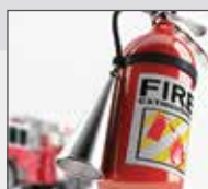
Fire safety (advanced fire protection service)