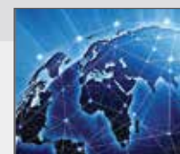
Internet leased-line service provided.